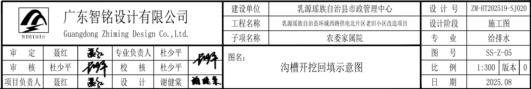
沟槽开挖回填示意图